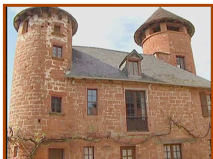
Tours de Friac-Collonges la Rouge

Au détour des sentiers voisins, la Basse Corrèze nous dévoile d'autres villages classés « plus beaux villages de France » et c'est ainsi que nous pouvons aisément passer des journées entières aux portes du Midi dans un cadre qui échappe au temps.