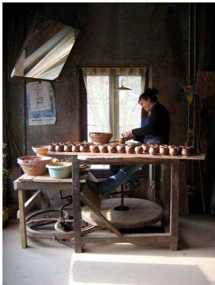
Poterie des Grès Rouges

La poterie est un des artisanats qui font la renommée de notre pays aux terres rouges.