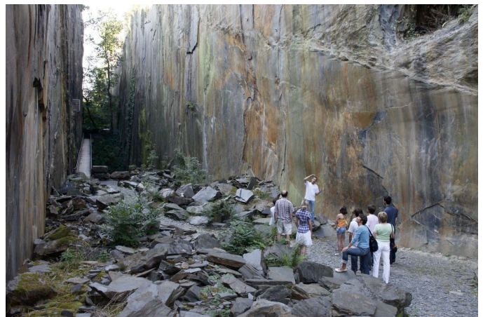
Pans de Travassac

Les Pans de Travassac sont de magnifiques filons d'ardoise exploités depuis le XVIIe siècle, à ciel ouvert.