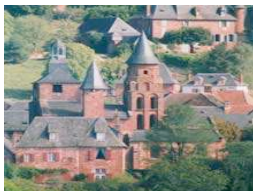
Collonges la Rouge