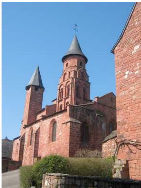
Collonges la Rouge

■ La journée « Villages et leurs traditions » n'est pas réalisable le lundi